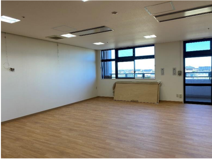
① リハビリエリア(2階)