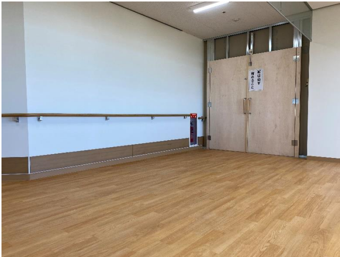
② リハビリエリア(2階)