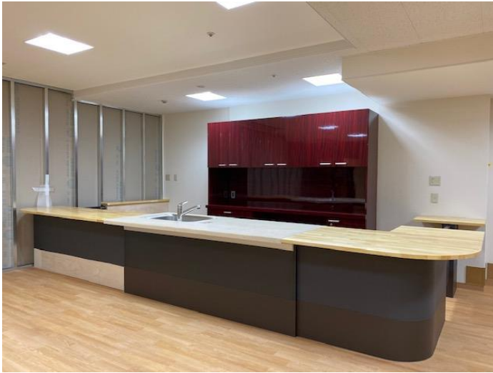
① 食堂キッチン3階 (アイランド式)